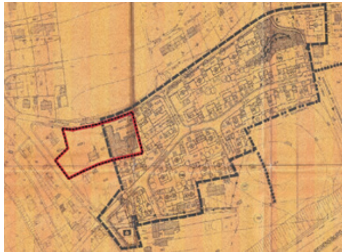
Bebauungsplan „Berzlfelsen I“; Darstellung ohne Maßstab, bearb. Markt Lappersdorf

Das Bebauungsplangebiet stellt eine bisher nicht aktivierte Baulücke mit Leerstand im Ortsbereich von Kareth unweit des Ortszentrums dar. Es ist zur Innenentwicklung und Nachverdichtung des Ortsbereichs geeignet. Wesentliches Ziel ist flächensparendes, verdichtetes Bauen mit Geschosswohnungsbau sowie die Realisierung von Wohnungen für verschiedene Familien- und Altersformen, insbesondere für altersgerechtes Wohnen bei gegebener Anbindung an den ÖPNV.