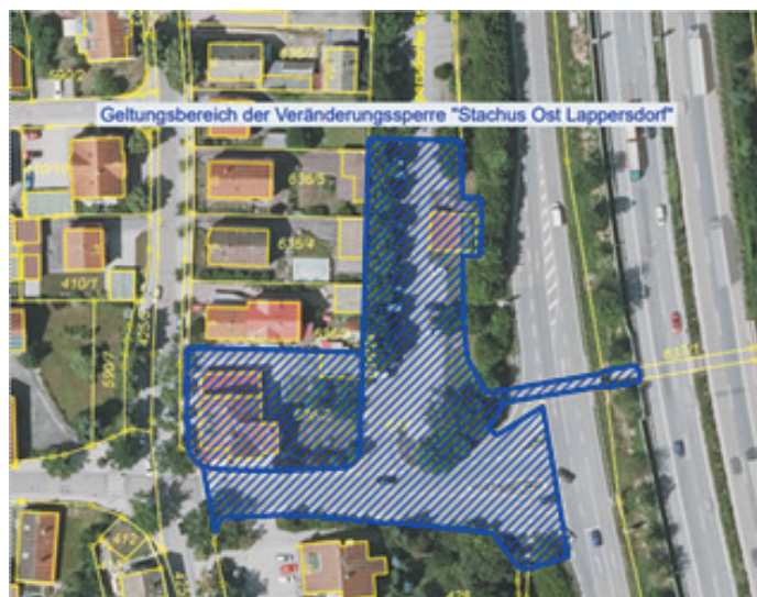
Ausschnitt Orthophoto ohne Maßstab, bearbeitet Markt Lappersdorf

Für den räumlichen Geltungsbereich der Aufhebung der Veränderungssperre ist der nachfolgende Lageplan maßgebend.