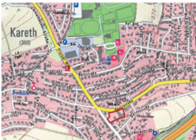
Ausschnitt topographische Karte, ohne Maßstab; bearbeitet: Markt Lappersdorf

Der räumliche Geltungsbereich umfasst die Flurstücke 802/3, 803/2 und 803/11, jeweils der Gemarkung Kareth mit einer Größe von ca. 0,46 ha. Der Geltungsbereich ist aus dem nachfolgenden Übersichtsplan ersichtlich.